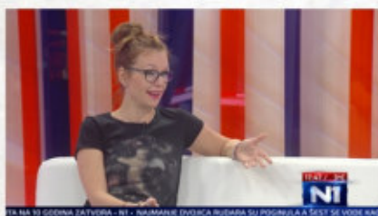
N1 Tri tačke