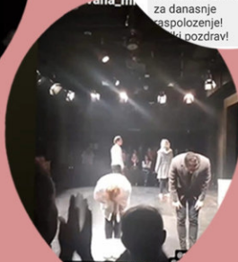
Pa pokidali ❤️❤️❤️

...uk. ...Belgrade, Serbia • ...na atmosfera sinoć, na Dan pozorišta, u teatru Vuk - katarzična predstava Balon u režiji Monike Romić - predstava koja nas otvara da dozvolimo sve emocije i da slavimo život u svakom dahu Odlična i osvežavajuća gluma, svaka čast svima a posebno Siniši koji dinamično, a sasvim tečno prelazi iz jedne u drugu u treću... Neću da otkrivam detalje, najbolje da pogledate svojim i doživite srcem drage divne duše zajedno, kao